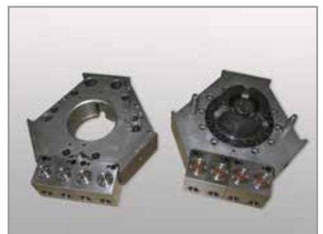
Werkzeugwechselsystem für eine Roboter-Handlingseinheit mit vier Kupplungselementen (Nennweite 8) als Druckölschnittstelle für ein hydraulisch betätigtes Schneidwerkzeug