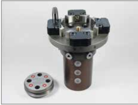
Kupplungs-Drehdurchführungssystem für eine Werkzeugmaschine mit vierfach Kupplungsschnittstelle und integrierter sechsadriger Drehdurchführung