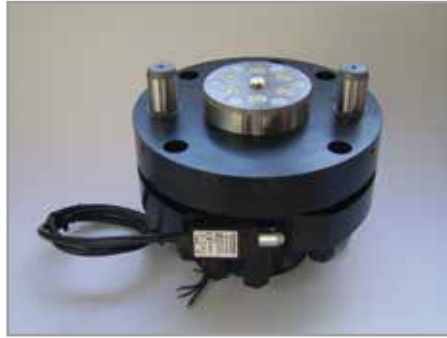
Andockeinheit mit sechs Kupplungsstellen, unter Druck kuppelbar; zum Andocken der Kupplungsplatte wird diese durch einen integrierten Hydraulikzylinder angehoben. Die Position wird mit einem elektronischen Sensor abgefragt.

Die Positionierung der Gegenkupplung erfolgt über zwei Bolzen.