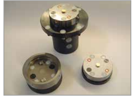
Kupplungssystem mit hydromechanischer Verriegelung mit zwei Kupplungsstellen:

Die Positionierung der Gegenkupplung erfolgt über zwei Bolzen.