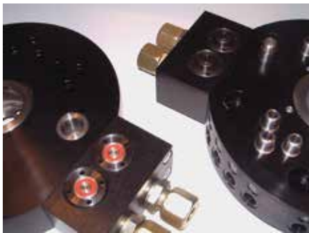
Kupplungselemente zur leakagearmen Druckölübertragung in Werkzeugwechselmodulen eines Roboters, bei denen zwei Hydraulikleitungen über Einschraubkupplungen (M24x1,5) gekuppelt werden.