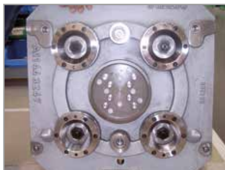
Kupplungsrippelplatte in der Vorrichtungspalette einer Werkzeugmaschine. Die Palette wird an die Docking-Einheit (Bild darüber) ange-dockt und hydromechanisch verriegelt.