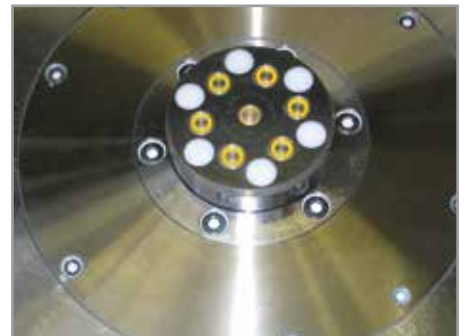
Kupplungsplatte für die Druckölübertragung in der Be- und Entladestation einer Vorrichtungspalette, die sechs Kupplungselemente sind unter Druck kuppelbar.