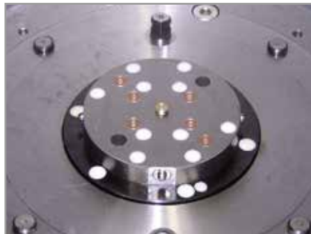
Docking-Einheit in der Be- und Entladestation einer Werkzeugmaschine, ausgerüstet mit einer Drehdurchführung, die eine 360° Drehbewegung der hydraulischen Spannvorrichtung erlaubt.