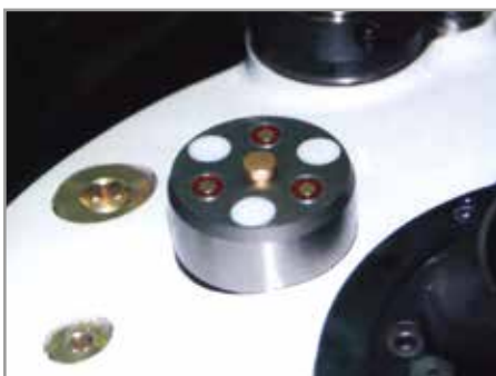
Dreifach-Kupplungssystem zur Druckölversorgung der Vorrichtungspalette in einer Werkzeugmaschine, die Verbindung in der Be- und Entladestation kommt durch das Absenken der Vorrichtungspalette zustande.